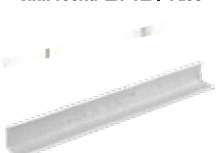
Thanh Viên Tường VTC 20/20