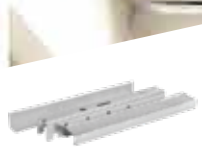
Hệ Trần Chìm VĨNH TƯỜNG BASI PLUS